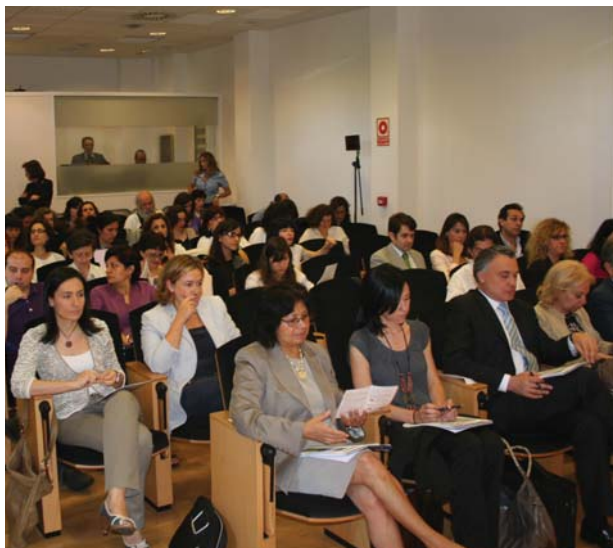
Más de 60 personas acudieron al encuentro