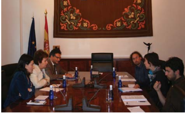
Reunión con las Brigadas Vecinales Observación DDHH | Defensor del Pueblo