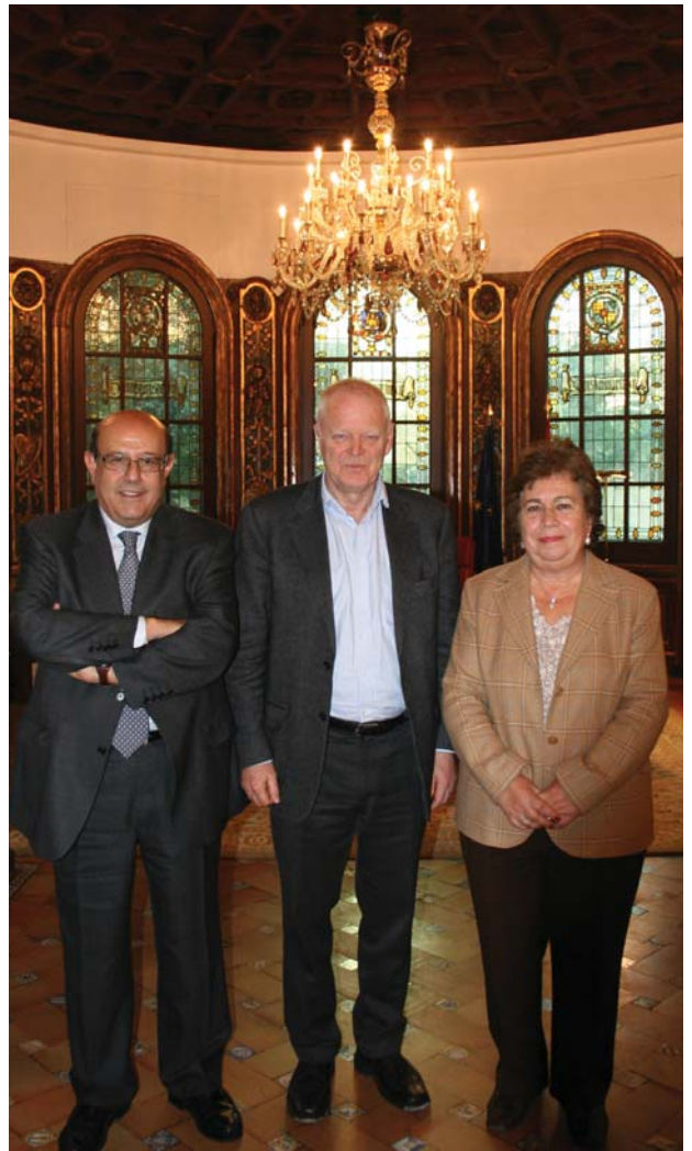
Hammarberg, con Cava de Llano y Aguilar | Defensor del Pueblo

¿Cómo valora usted la situación de los derechos humanos en el siglo XXI? ¿Hemos progresado en la defensa y promoción de estos derechos?