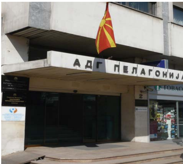
Sede del Ombudsman de la Antigua República de Macedonia, en Skopje. | Defensor del Pueblo

A lo largo de su historia, la institución del Defensor del Pueblo ha colaborado también en diversas misiones de ayuda técnica proporcionada a gobiernos e instituciones similares, asesorando sobre la organización y funcionamiento de las defensorías. Es el caso de los denominados proyectos “twinning” que, promovidos por la Unión Europea, la institución ha emprendido en Kazajstán, Armenia y la Antigua República Yugoslava de Macedonia. Con ello, se pretende potenciar actividades de apoyo y asesoría con vistas a homologar los procedimientos de actuación de las instituciones de países no comunitarios con las instituciones europeas miembros de la UE.