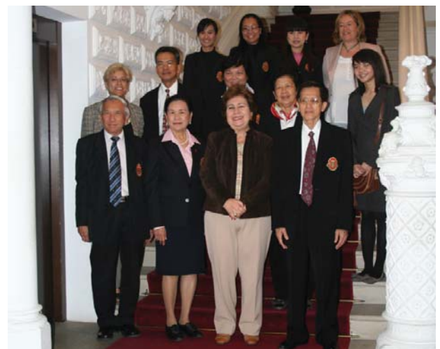
Visita Ombudsmen tailandés | Defensor del Pueblo

Durante la reunión mantenida en la oficina del Defensor del Pueblo, se les explicó detalladamente el sistema español de Ombudsmen y concretamente la institución del Defensor del Pueblo. También se expusieron buenas prácticas de interés para los visitantes.