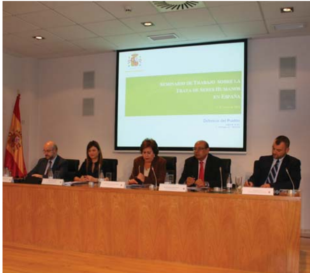
Inauguración de las jornadas | Defensor del Pueblo

en explicar el contenido de la Directiva 2011/36/EU, basada en una proposición de la Comisión Europea de 2010, cuya trasposición entrará en vigor en los Estados miembros en el plazo de dos años. Según Bezcala, esta Directiva reforzará en gran medida la lucha contra la trata porque incrementará las penas por estos delitos. Además, la representante del Comisión Europea resaltó la importancia de que la citada directiva contempla que no habrá castigo para la víctimas por actividades fuera de la ley, si éstas se han visto envueltas en una red ilegal de trata.