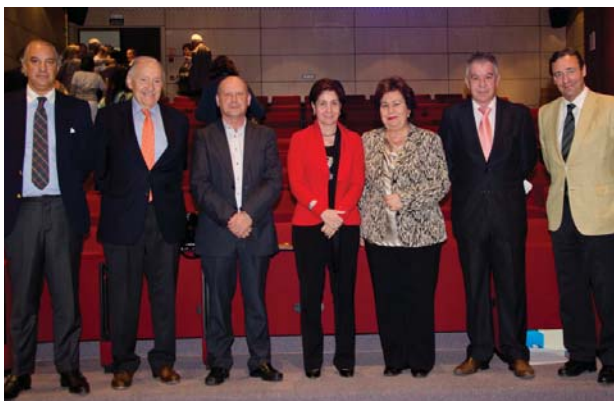
Jornada sobre fundaciones sanitarias | Fundación Española del Corazón

La reunión giró en torno a temas de interés de ambas instituciones, para posibles acciones de apoyo, colaboración y capacitación, en asuntos tales como la prevención de la pornografía infantil en internet, la participación ciudadana en derechos humanos, la atención a personas con discapacidad, y las migraciones.