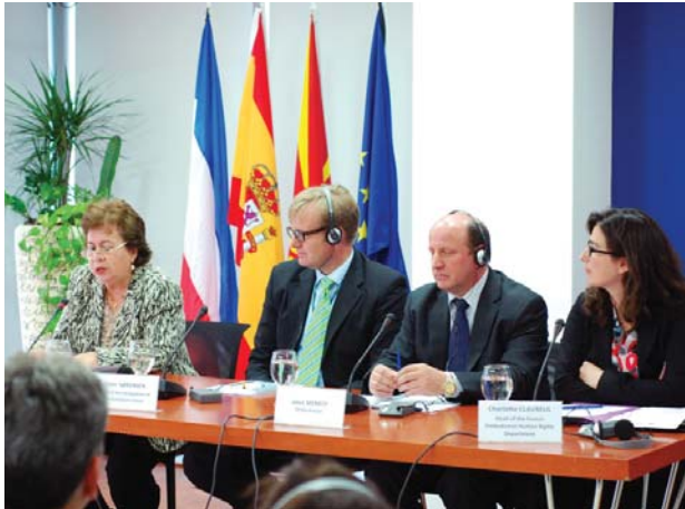
Presentación del proyecto de hermanamiento con el Ombudsman de Macedonia

La rápida extensión del modelo ibérico de Defensor del Pueblo hacia otros sistemas jurídicos afines se debe en gran medida al éxito interno de una institución que siempre ocupa los primeros puestos de las encuestas sociológicas, en lo que a la confianza de los españoles se refiere. En este contexto, la Defensoría siempre ha cuidado con especial atención su proyección internacional, consciente de su papel como referente, no sólo ya en el ámbito ibe-