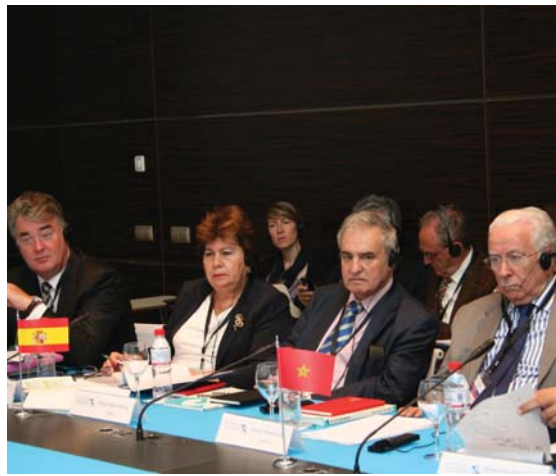
Reunión de la AOM en Madrid, en junio de 2010

Por otra parte, y dentro de la estrategia del Defensor del Pueblo de estrechar lazos con aquellos organismos internacionales dedicados a la protección y promoción de los derechos humanos en los que España participa como Estado miembro, destaca la colaboración con Naciones Unidas, canalizada a través de la Oficina del Alto Comisionado para los Derechos Humanos. De hecho, la Institución participa periódicamente en las reuniones que tienen lugar en la sede de la ONU en Ginebra exponiendo su parecer respecto a la situación de los derechos humanos en España y, en concreto, valorando los informes que puedan ser objeto de examen. La última intervención de la Defensoría en una actividad de este tipo data de febrero de este año, cuando participó en el 78º periodo de sesiones del Comité para la Eliminación de la Discriminación Racial (CERD) de Naciones Unidas, celebrado en el Palacio Wilson en Ginebra. Tras este encuentro, la ONU, que ha celebrado públicamente las aportaciones del Defensor, ha reclamado a España que acabe con las "redadas policiales basadas en perfiles étnicos" derivadas de la circular 1/2010 de la Comisaría General de Extranjería y Fronteras, circular que ha sido criticada por la Unión Europea, el Consejo de Europa y esta Defensoría, en repetidas ocasiones.