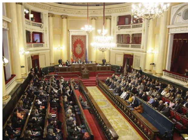
XIV Congreso de la FIO, celebrado en el Palacio del Senado en 2009.

La AOM, por su parte, fue creada en 2008 bajo el auspicio